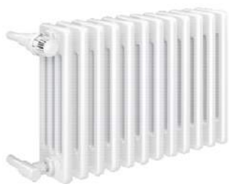
DELTA LASERLINE STANDART