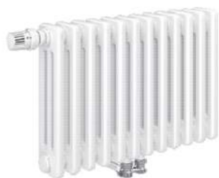
DELTA LASERLINE VENTIL